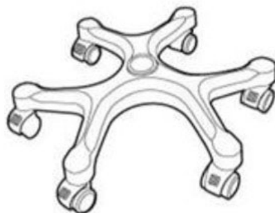
Шестилучевая крестовина с фиксируемыми колёсами